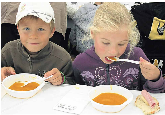
Pour dîner, les enfants ont mangé une délicieuse soupe à la courge maison.