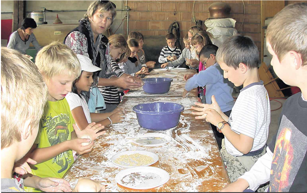
Les enfants ont confectionné un petit pain qu'ils ont pu prendre à la maison.