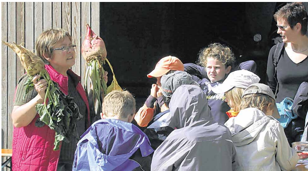
D'où vient le sucre suisse? De la betterave...