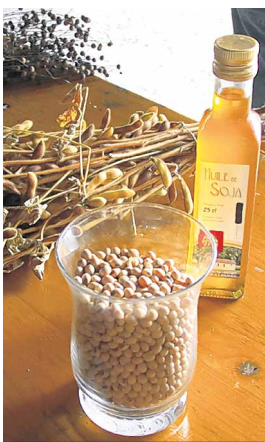
Colza: de la graine à l'huile.

La famille Gerber et les paysannes se sont données beaucoup de peine pour offrir un moment agréable aux enfants. Les enseignants apprécient cette démarche qui allie plaisir et apprentissage éducatif. Une telle découverte à vivre «en vrai» à l'époque du virtuel semble devenir très important pour les enfants.